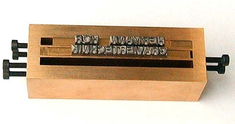
Spannmaß Standard 3,92 mm type holder, clamping size 3,92 mm